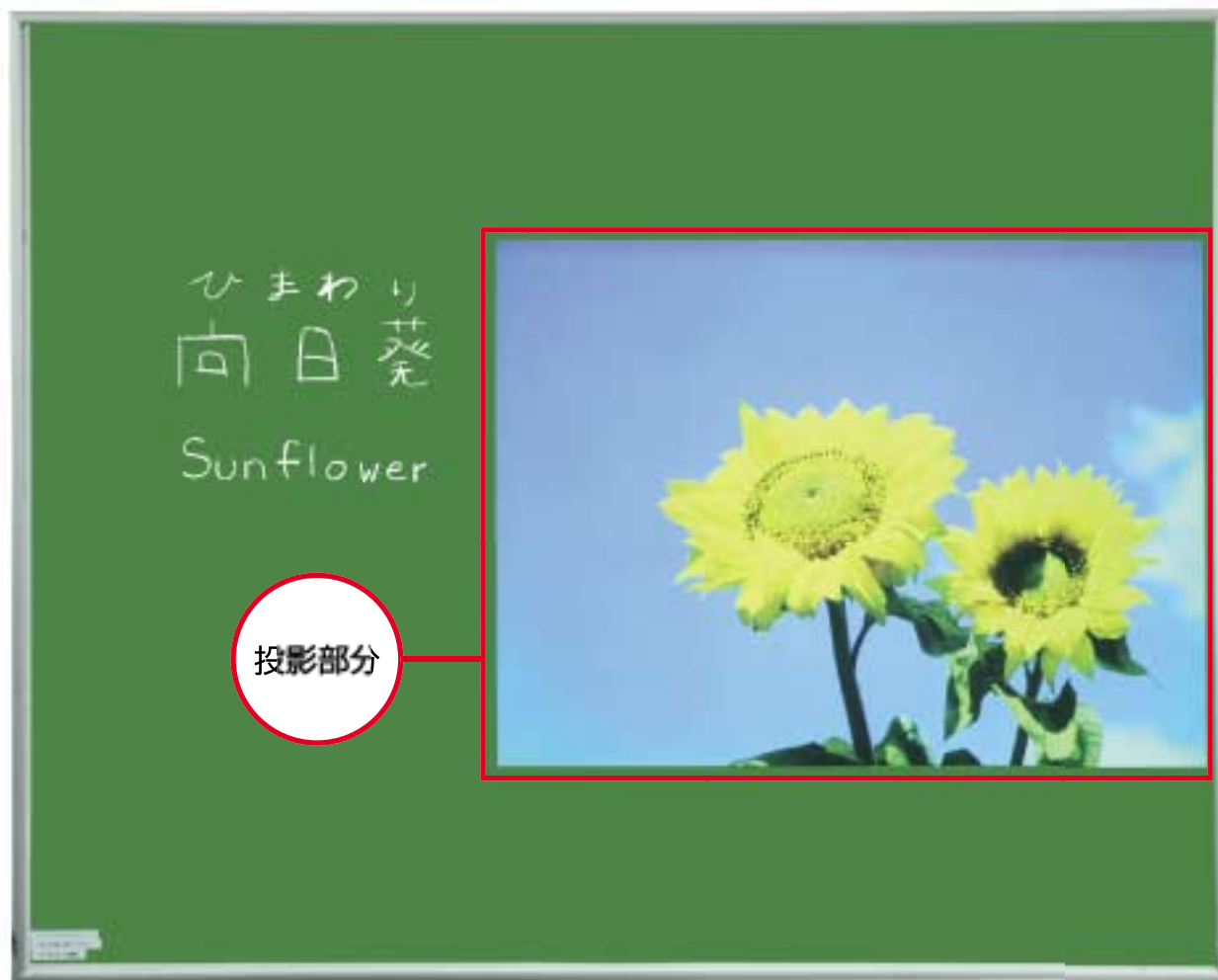
映せる黒板 美映え(びばえ)品番B-524-CMM)

You can project, write with chalk and erase it with ease. new type chalkboard with multi-function Chalk Projection Board